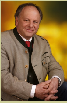
Bürgermeister Hans Fugger