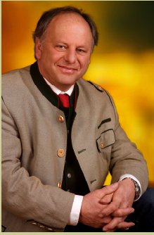
Bürgermeister Hans Fugger