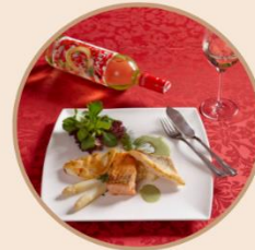
ganztägig warme Küche