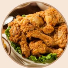
Jeden Samstag Backhendl