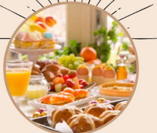
NEU: FAMILIEN ZIRKUS BRUNCH IM JUNI