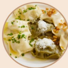
Jeden Freitag Käsnudeln nach Omas Rezept