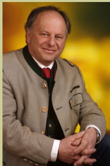
Bürgermeister Hans Fugger