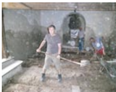
Schwere Arbeit beim Restaurieren