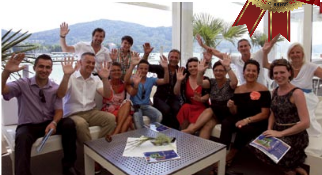
Das sympathische Team von IGEL IMMOBILIEN bei der 20-Jahre Feier am traumhaften Wörthersee.

Mit einer wunderschönen Jubiläumsfeier konnte die Firma IGEL IMMOBILIEN im Juni 2013 ihren 20-jährigen Bestand feiern. In den letzten 20 Jahren entwickelte sich das Unternehmen zu einem der größten Immobilien-Anbieter in Kärnten.