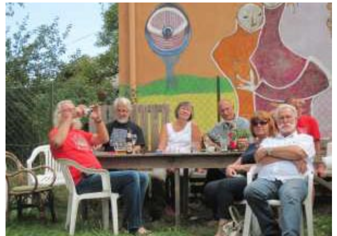
Work-Shop „Landart“ mit dem Kunstquadrat Bischofshofen, das seine Spuren in Glödnitz hinterlassen hat.