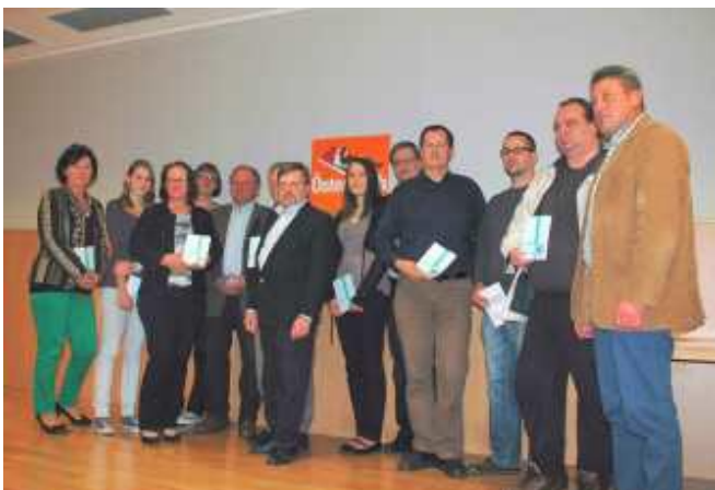
Verleihung des 1. Glödnitzer Literaturpreises gemeinsam mit dem Memoiren-Verlag Bauschke