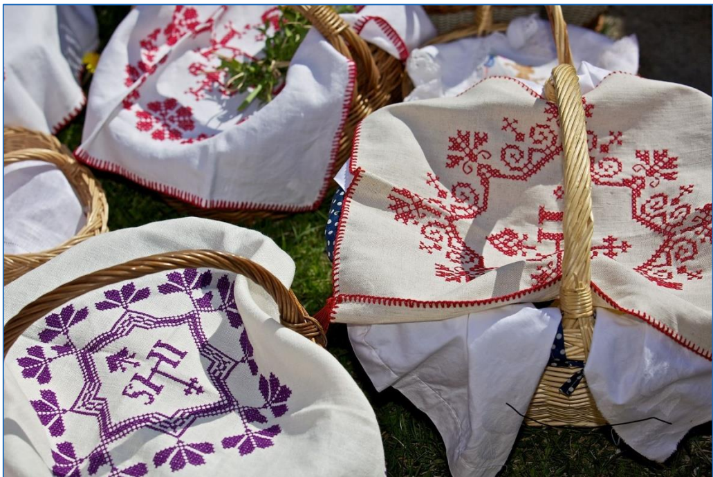
Ostern in Kärnten